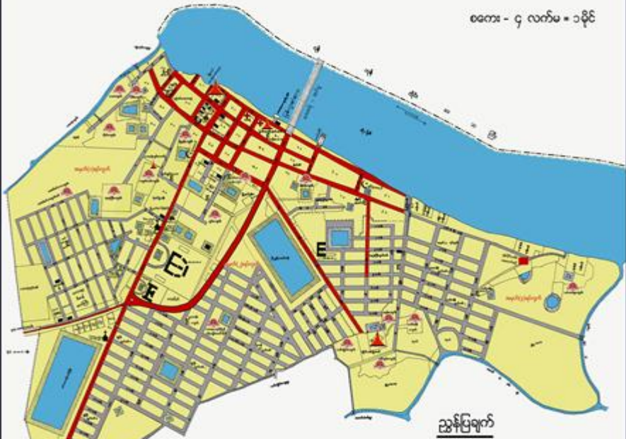
ညွှန်းပြချက်